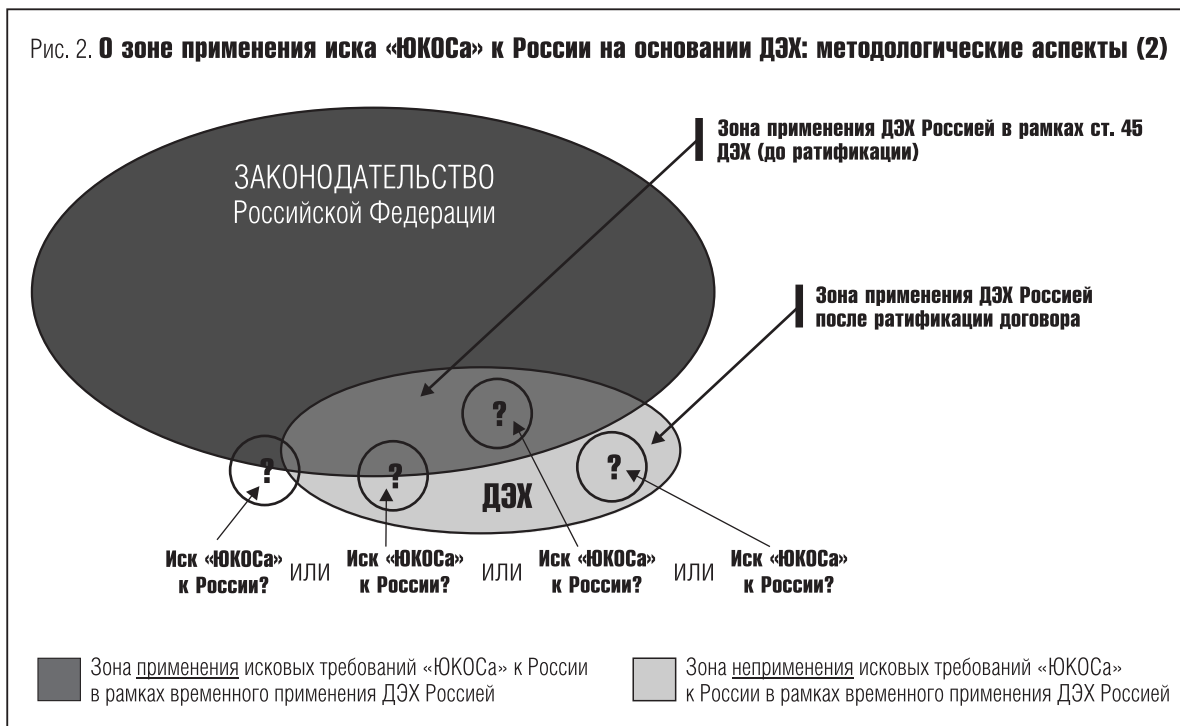
Рис. 2. О зоне применения иска «ЮКОСа» к России на основании ДЭХ: методологические аспекты (2)

длительной содержательной дискуссии сторон — определение предмета иска по существу. Как правило, в международных судах все вопросы, связанные с возможностью отнесения предмета спора к вопросам политически мотивированной экспроприации или экономически обоснованной компенсации за накопленные выпадающие доходы по налогообложению (уход от налогов), рассматриваются с повышенной тщательностью, поскольку уплата налогов — это одна из фундаментальных основ, на которых зиждется экономических благосостояние любого государства. И так, уже этот, первый, вопрос в ходе рассмотрения иска по существу займет, по-видимому, не меньше времени, чем потребовалось на констатацию очевидного, на наш взгляд, положения о правомочности рассмотрения трибуналом иска по существу и на вынесение решения по юрисдикции и допустимости.